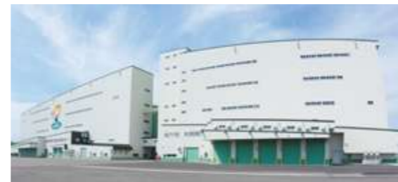
網走市麦類乾燥調製貯蔵施設

建築にあたっては、建設資材の価格・需給動向や、建設コスト低減に向けた新工法・資材の情報収集に注力。期日までに施設の引き渡しができるよう、工事期間中の安全管理、工程・工事監理を徹底しています。一方、食の安全・安心への要求の高まりを受け、高品質な農産物の出荷に向けた施設の普及も推進。これらに関する新技術の検証や試験についても、関係機関と連携して積極的に取り組んでいます。