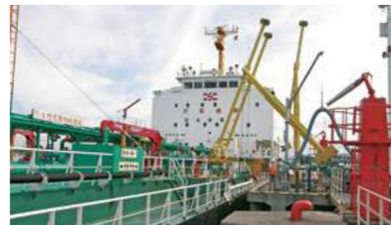
タンカーからの燃料油の受入作業（苫小牧石油貯蔵施設）

石油元売などから仕入れた燃料油は、石油貯蔵施設にタンカーで一括受け入れ、タンクに貯蔵。そこから、全道のホクレンSS、JAOC（農協広域石油宅配センター）、JAの備蓄タンクなどに配送されます。受け入れから配送までを一貫しておこなうことにより、仕入・物流コストを低減し、信頼できる価格での供給に努めています。さらに、組合員のみなさまの営農コスト低減に向け、営農用免税軽油、麦・籾乾燥用灯油、ハウス・牛舎用燃料油について特別対策を実施しています。