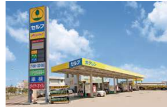
ホクレン新さっぽろSS

「ホクレンSS E'-NET」 http://www.hokuren-ss.jp