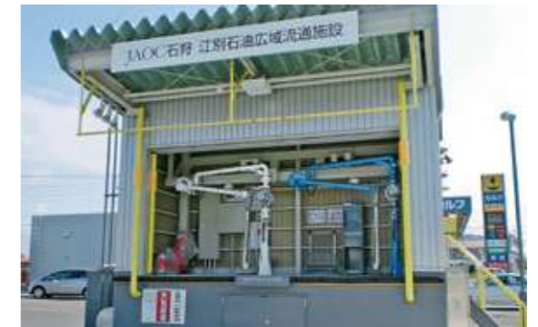
JAOC石狩 江別石油広域流通施設